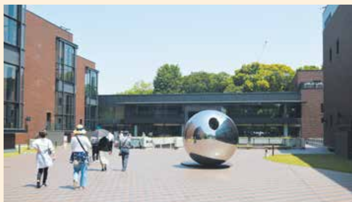
東京都美術館外観