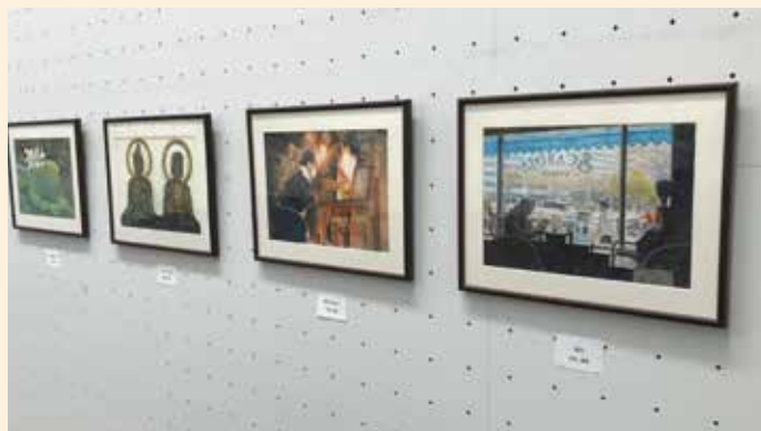
第3回 絵画展・写仏展会場の様子