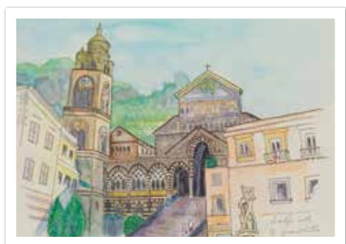
「アマルフィのドゥオーモ」 山下 よう子