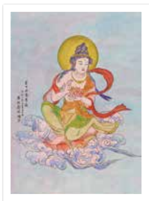
「雲中供養菩薩」 木村 壽昭