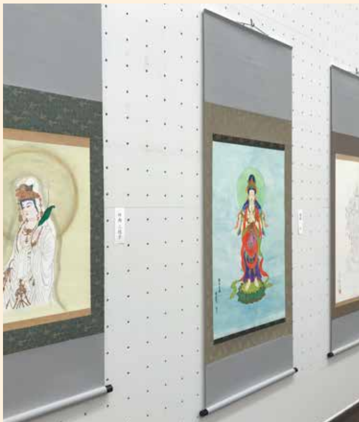
第3回 絵画展・写仏展会場の様子

あなたの作品が東京都美術館に展示されるまたとない機会です。 ぜひ、あなたのご出品をお待ちしております。