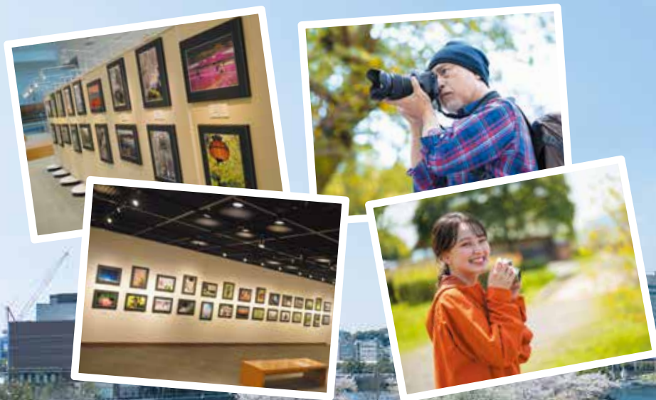
※会場の模様は前回写真展より。