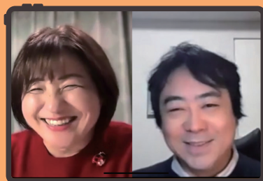
短歌友の会オンラインコース 「選評座談会」より