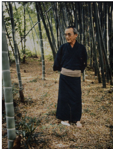
飯田龍太 (NHK学園俳句講座創設者)